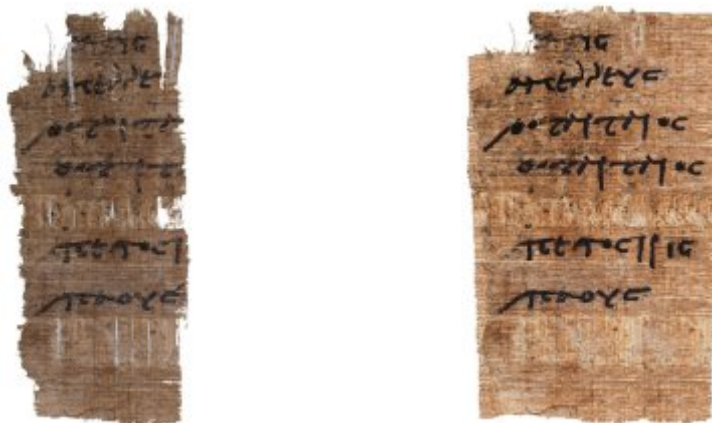
Frammento di papiro greco, di epoca tolemaica (III/II a.C.), contenente una lista di persone. La prima immagine è la riproduzione fedele e la testimonianza puntuale dell'originale; la seconda è l'elaborazione della prima e la nuova immagine del documento ripristinato. Il sistema di ripresa e trattamento digitale utilizzato ha consentito l'individuazione di tracce di inchiostro non visibili ad occhio nudo ed una migliore lettura del documento. Il restauro virtuale ha ottimizzato la leggibilità delle informazioni.

L' archivio del materiale papiroaceo realizzato, oltre alle schede descrittive, contiene le immagini dei papiri greci e demotici, sia ad altissima risoluzione (6000x7000 pixel), in formato TIFF, per lo studio approfondito ed il restauro virtuale da parte degli esperti, sia a bassa risoluzione (550x850 pixel), in formato JPEG, per la consultazione on-line da parte dell'utenza. Un esempio di riproduzione digitale e di restauro virtuale del documento sono le immagini del papiro che proponiamo in basso.